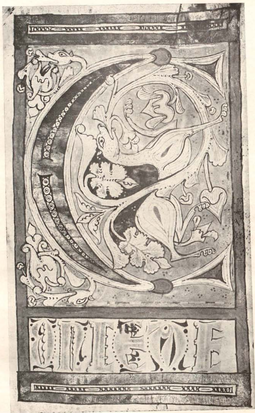
Fig. 16. — Museu Episcopal de Vich : Còdex 68, f. 80 v.