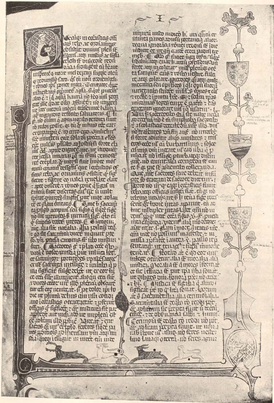
Fig. 21. — Museu Episcopal de Vich : Códex 132, f. 1