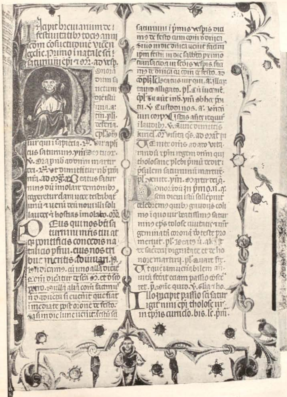
Fig. 17. — Museu Episcopal de Vich : Códex 82, f. 314